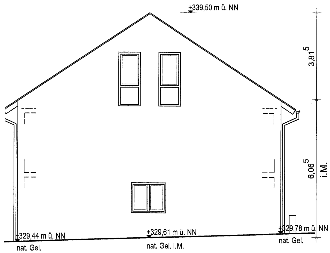
SÜDWESTSEITE (GIEBELSEITE) (WANDHÖHE)